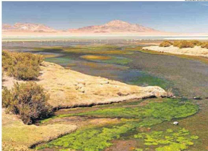
EL SALAR DE ASCOTÁN, UBICADO EN OLLAGÜE, ES UNO DE LAS ZONAS DONDE SE EXPLORARÍA Y EXPLOTARÍA LITIO.