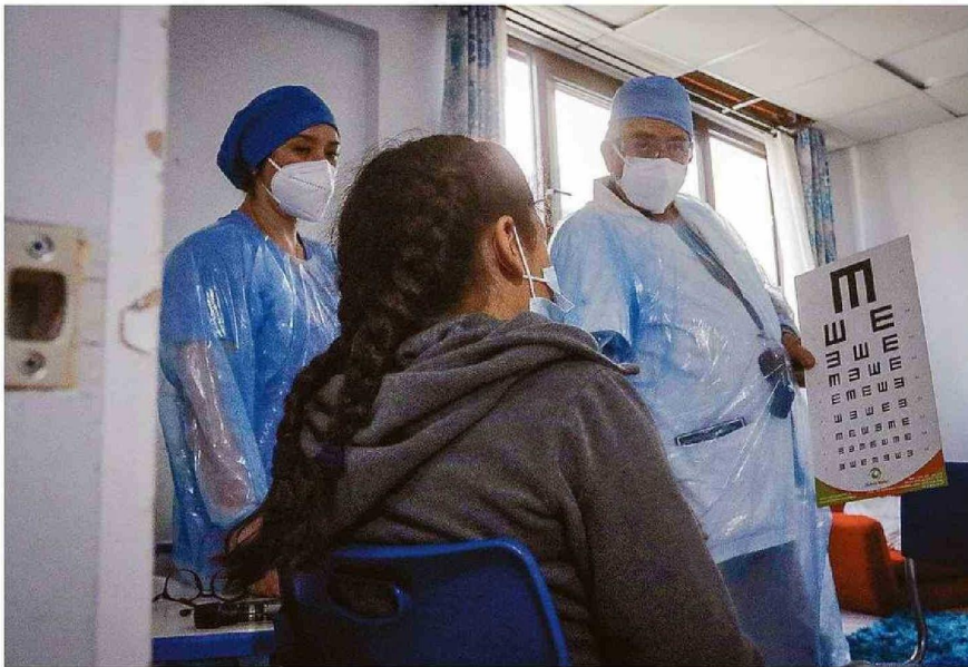
OFTALMOLOGÍA ES UNA DE LAS ÁREAS DONDE SE CONCENTRA EL DÉFICIT DE ESPECIALISTAS.