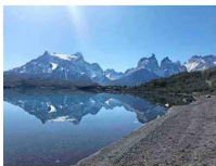
Torres del Paine.