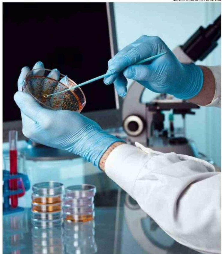
UNIVERSIDAD DE LA FRONTERA

Reiterando su liderazgo como referente en investigación y tecnológica en Chile, investigadoras e investigadores jóvenes obtuvieron la adjudicación de diez proyectos Fondecyt de Posdoctorado 2025. Gracias a estos logros, la Ufro