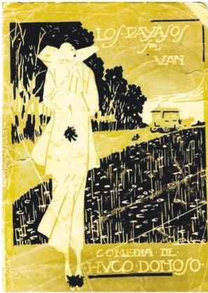
Portada de la comedia "Los payasos se van", editada en 1916 y hoy muy difícil de ubicar.