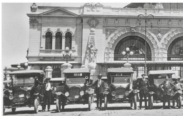
Taxistas de Santiago en 1917.

toria y Alhambra de Santiago y en poco tiempo llegó a todos los cines del país. En Talca se exhibió el 17 de diciembre de 1921 en el Teatro Palet, debiendo repetirse la función dos veces. Los restos fueron sepultados en el mausoleo de la familia Donoso Grillé, parientes suyos. No obstante, en 1997 examinamos los archivos del Cementerio General y el lugar de la inhumación, sin encontrar rastros de su lápida; suponemos que alguna reducción hizo desaparecer su nombre del lugar. ●