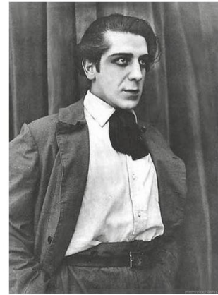
Pedro Sienna, director y actor de "Los payasos se van", de 1921.

H ugo Donoso Gaete, talento premonitorio desde casi la adolescencia, nació en Santiago el 5 de enero de 1899. Fue alumno, como tantos de esa época, del Instituto Nacional. Al egresar, siguió la carrera de leyes en la Universidad de Chile. Desde casi los trece años inició colaboraciones literarias en "Zig-Zag", con el seudónimo de Hugonote. Hizo crítica de libros y dio a conocer poemas de innegable talento.