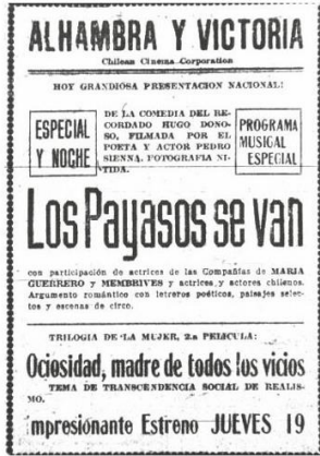
Anuncio de la exhibición de la película "Los payasos se van", en 1921, en Santiago, dirigida por Pedro Sienna.