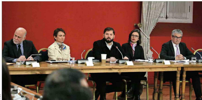
“Sabemos que (la reforma de pensiones) es una urgencia para la gran mayoría de los chilenos y chilenas, aunque algunos parecieran querer negarlo”, dijo Boric en el encuentro.

Pese a un mal resultado en el Imacec de mayo, el mandatario habló de que en Chile surgen los brotes verdes. Desde Chile Vamos criticaron que falta claridad respecto del proyecto de pensiones.