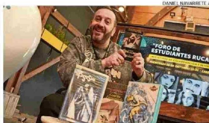
EL PERIODISTA ROCKSTAR TRAJÓ TÍTULOS ERÓTICOS Y DE ANIMÉ.