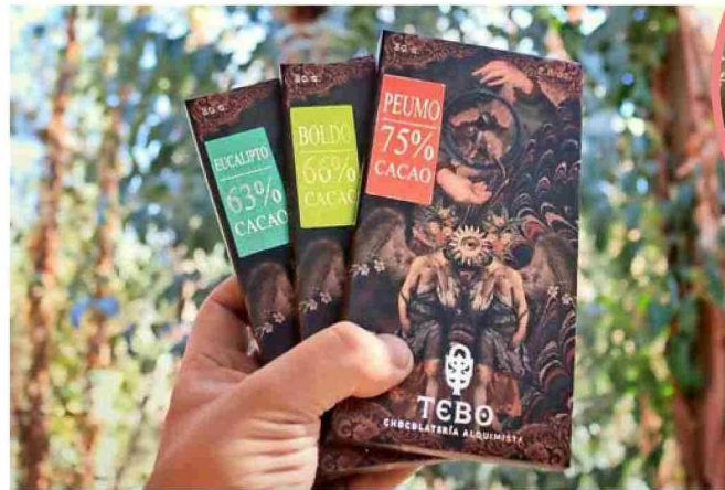
CHOCOLATES EN VARIEDADES de eucalipto, boldo y peumo.