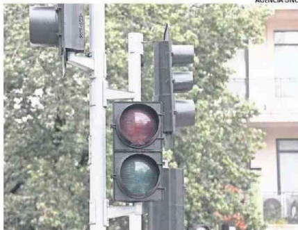
VECINOS SEÑALARON RIESGOS DE ESTAR SIN LUZ.

J. Pablo Fariña López cronica@estrellaconce.cl