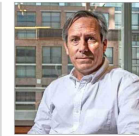
El exsubsecretario de OO.PP. insiste en sus cuestionamientos.

HOY SE REVISARÁ RECURSO CLAVE PARA DEFINIR LA PERMANENCIA DEL DIRECTOR DE CARABINEROS | C1 y C2