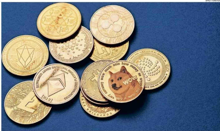
LAS MEMECOINS, COMO TAMBIÉN SON DENOMINADAS, ESTÁN INSPIRADAS EN MEMES O PERSONAS Y PERSONAJES POPULARES.

“Las criptomonedas memes se les llama así por-