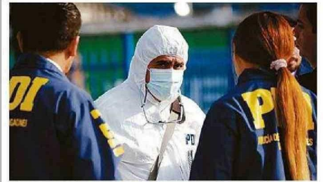
SE HABRIAN DESCARTADO LESIONES ATRIBUIBLES A TERCEROS.