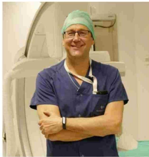
Dr. Tomás Datino, cardiólogo especialista en arritmias.

Los trombos o coágulos sanguíneos no sólo se forman en el corazón. También se pueden generar en las venas de las piernas y migrar desde allí a otras partes del cuerpo, llegando al cerebro y provocando un ictus. Un cardiólogo especializado en arritmias explica las opciones para prevenir este tipo de trastornos.