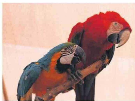
EL SÁBADO 22 DE FEBRERO HABRÁ UN BUS DE ACERCAMIENTO EN EL SALADO.