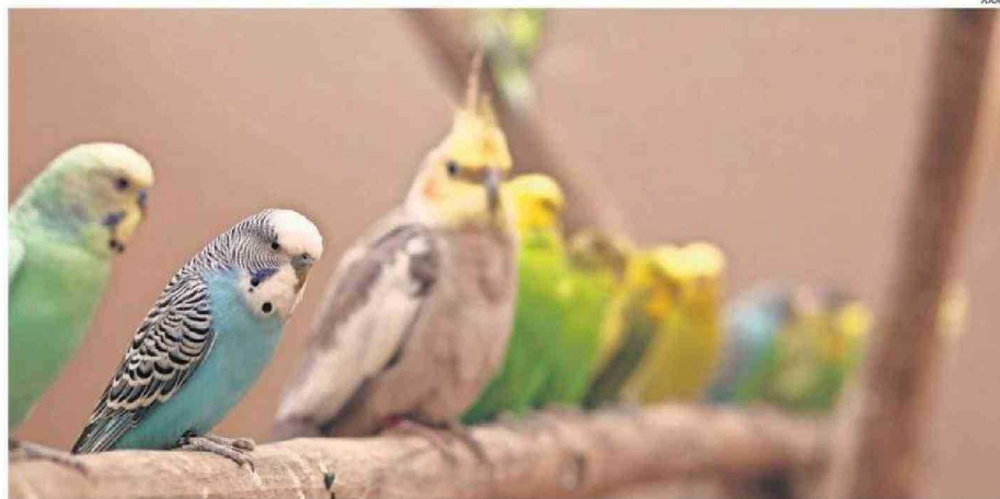
LA EXHIBICIÓN "SELVA VIVA" ES ITINERANTE Y RECORRE CADA RINCÓN DEL PAÍS. EN ESTA OCASIÓN, FUE EL TURNO DE LA COMUNA PUERTO DE CHAÑARAL.