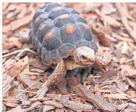
"SELVA VIVA" ESTÁ UBICADA EN EL VIVERO MUNICIPAL DE CHAÑARAL.