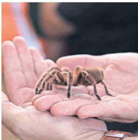
GRANDES Y CHICOS PODRÁN DISFRUTAR DE LA EXHIBICIÓN NATURAL.

Título: Selva Viva llega con toda su fauna a la comuna puerto de Chañaral