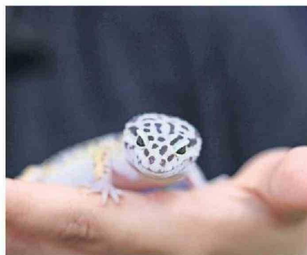
LOS HORARIOS DE LA MUESTRA SE EXTIENDEN DE 12 A 18 HORAS.