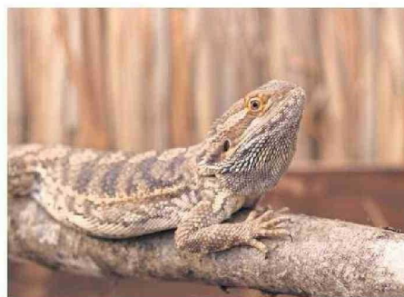
LA COMUNIDAD CHAÑARINA QUEDA INVITADA A DISFRUTAR DE LA ACTIVIDAD.