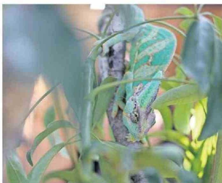
LA MUESTRA ESTARÁ DISPONIBLE HASTA EL DÍA 24 DE FEBRERO.