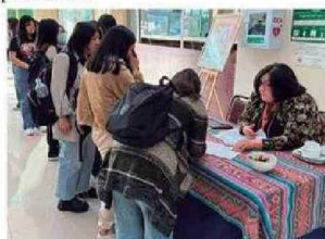
Personas presenciaron y fueron partícipes de la Obra de Teatro LOS MAZALEZ en CFT Arica.