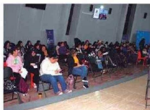
Personas presenciaron y fueron partícipes de la Obra de Teatro LOS MAZALEZ en Iquique.