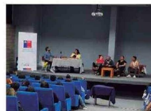
Personas presenciaron y fueron partícipes de la Obra de Teatro LOS MAZALEZ en UTA Arica.