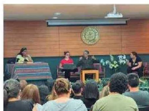
Personas presenciaron y fueron partícipes de la Obra de Teatro LOS MAZALEZ en Santo Tomás Arica.