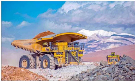
La minería es el único sector de la economía que tiene una perspectiva optimista, a diferencia de la construcción, el comercio y la industria.