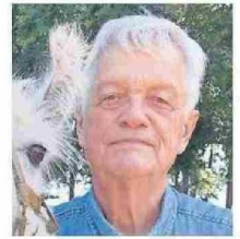
HEINRICH VON BAER.

men y el grupo folclórico El Rosal. Y entre sus logros personales está el ser campeona nacional de la cueca valseada 2020.