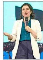
Reemplaza a Camila Vallejo, quien se va con prenatal.