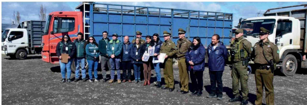
LA FISCALIZACIÓN por parte de autoridades se realizó durante la mañana de este lunes, en la Feria de Animales Tattersall.

En este contexto, “es importante que nuestros usuarios sigan las recomendaciones que año a año realizamos a la comunidad, respecto a comprar los alimentos para fiestas patrias, especialmente el producto cárnico, solo en locales establecidos, no romper la cadena de frío y evitar la contaminación cruzada al momento de manipular estos alimentos”, recaló Gutiérrez.