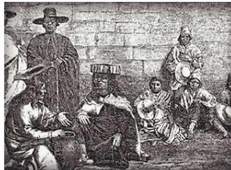
↑ ATACAMEÑOS HACIA FINES DEL SIGLO XIX.

tradicional es la limpia de los canales riego en todos los pueblos de la provincia del Loa. Hoy día se ha recuperado como una fiesta relacionada con la Pachamama, madre diosa de la tierra a quien se le pide por los futuros sembradíos y la reproducción de los animales domésticos. En la aldea de Tulor se han realizado excavaciones y por medio del carbono 14 se calcula que hace tres mil años ya se realizaba. Esta limpia de los canales se efectúa a mediados de agosto, período en que se comienza a sembrar el maíz, se corta la alfalfa, se podan los árboles y algunos agricultores siembran otras plantas que hoy día se producen aquí. O sea, se prepara la tierra para una buena producción, pidiéndole ayuda a la Pachamama.