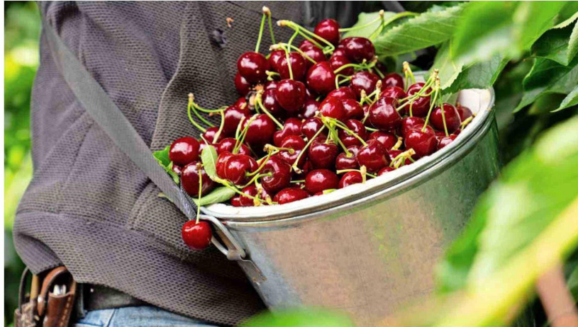
Los volúmenes de producción de 2024-2025 son mayores a los de la temporada pasada.

En las próximas semanas los arribos a costas chinas se dispararán, con algunos barcos que llegarán con más de 1.000 contenedores cada uno. El desafío de vender cerca de 120 millones de cajas en la temporada 2024-2025, un volumen casi 50% mayor que en la