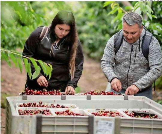
Esta semana marca el período de mayor cosecha en la temporada con el ingreso de las lapins y luego de las reginas.

Uno de los principales temores a nivel de embalaje no se cumplió. La aparición de la mosca de la fruta en Chimbarongo y parte de la Región Metropolitana ha obligado a cumplir protocolos de tratamientos de frío para la exportación a China para los productores y procesadores de esas zonas.