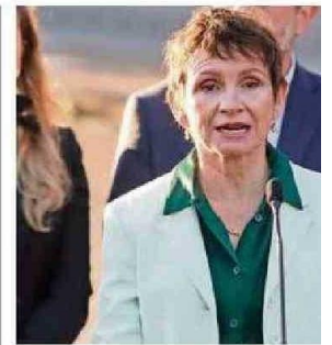
LA JEFA DE GABINETE HABLÓ SOBRE LA

Tohá: la suspen- de vuelos ve es “inhuma