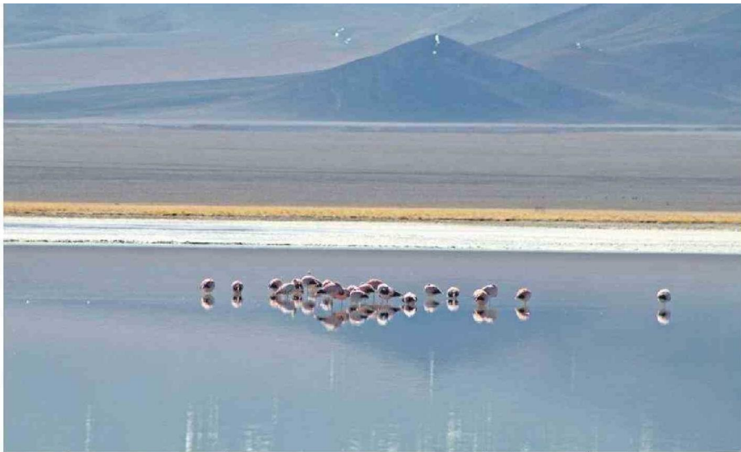
LA EXPOSICIÓN ABORDA COMO LA EXPLOTACIÓN DEL LITIO PUEDE SUPERAR LOS COMBUSTIBLES FÓSILES, PERO NO ESTÁ EXENTA DE RIESGOS.

ron desde la Alianza Potencia Energética, la plataforma de centros de pensamiento, organizaciones artísticas y redes de periodistas desde donde se lanzó la convocatoria "Narrar la TEJ", que dio origen a la exposición fotográfica bogotana como su primera muestra concreta, pero que prepara más acciones de difusión artística y espacios de deliberación en Chile, Colombia y otros países del continente.