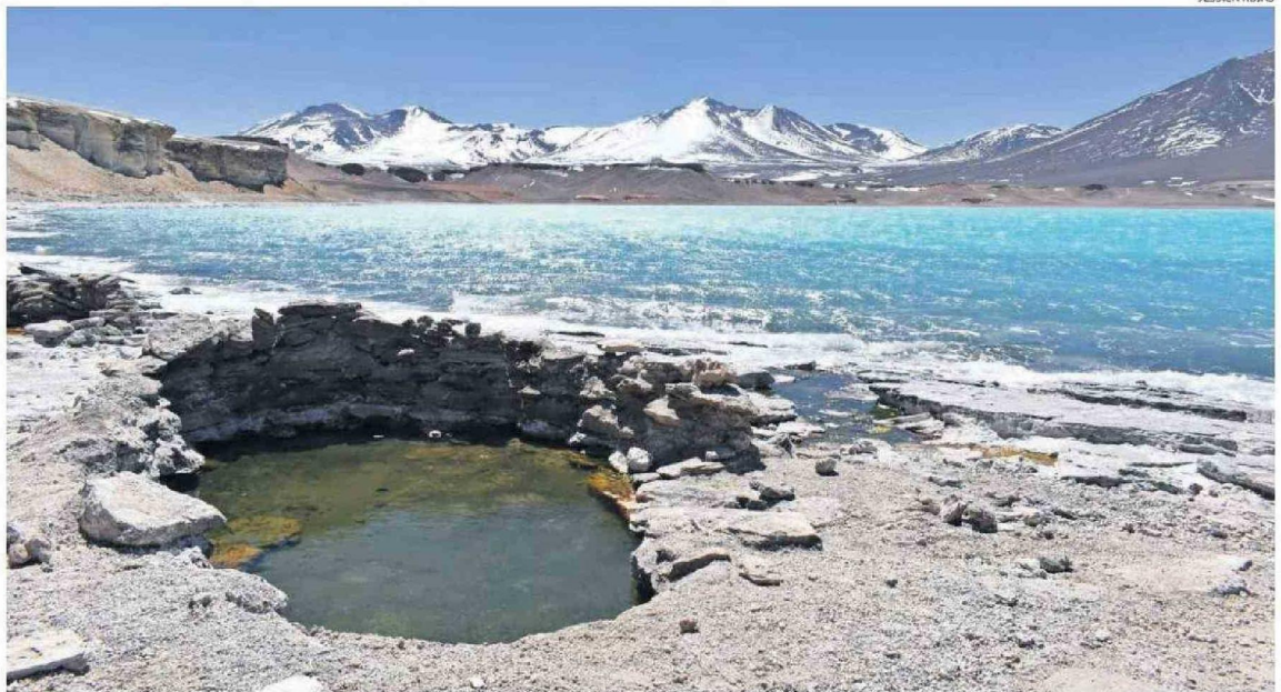
LA EXPOSICIÓN ABORDA LA TRANSICIÓN ENERGÉTICA EN CHILE Y COLOMBIA, INCLUYENDO A LA REGIÓN DE ATACAMA, DONDE SE PROYECTAN FUERTES INVERSIONES POR EL LITIO.