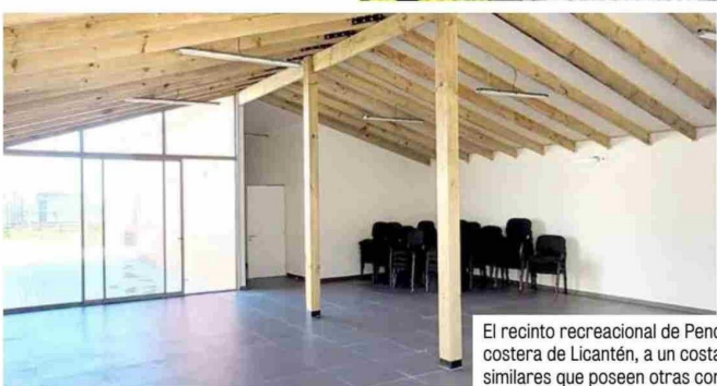
El recinto recreacional de Pencahue se ubica en la ruta costera de Licanén, a un costado de los espacios municipales similares que poseen otras comunas de la región.

PENCAHUE. Felices reaccionaron los vecinos y dirigentes sociales luego que el Municipio informara que la construcción del recinto en la costa de Licanén estaba concluido y listo para su pronta inauguración. El proyecto, definido como prioritario por la administración del alcalde José Miguel Tobar, tiene su recepción de obras aprobada tras cerca de seis meses de iniciada su edificación, en el popular balneario de Duao, en el mismo sector donde otras comunas como Pelarco y Rauco. La inversión, realizada con recursos FNDR vía proyecto FRIL, tuvo un costo cercano a los $ 127 millones de pesos. Está ubicada frente al mar en un terreno gestionado con Bienes Nacionales con financiamiento otorgado por el Gobierno Regional del Maule. Consiste en una edificación de 130 m2 con un salón, cocina, baño,