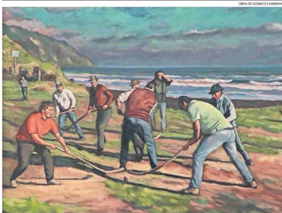
OBRA DE DIONICIO ZAMBRANO