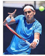
El chileno sucumbió en cuatro sets ante el español Roberto Carballes.

► Informe indica que la incapacidad de forjar alianzas y mecanismos de integración podría conducir a la región a la irrelevancia internacional. | A 4