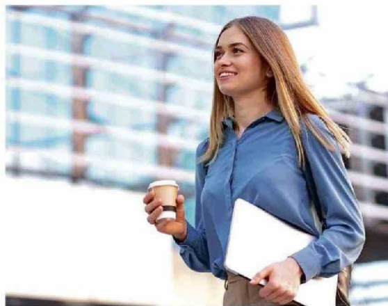
Cómo enfrentar el regreso al trabajo y a la rutina tras el periodo de vacaciones será el tema del primer conversatorio impulsado por Mutual de Seguridad.

"Este ciclo de conversatorios está alineado con el propósito de Mutual de Seguridad de proteger y mejorar la calidad de vida de los trabajadores y sus familias. Como referentes en los temas asociados a la protección y el bienestar, creemos que esta alianza nos permitirá generar conciencia sobre aquellas temáticas que tie-