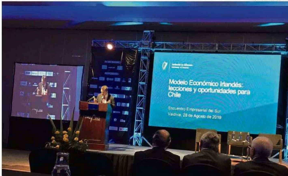
EL EESUR SE REALIZA DESDE 2006 Y SUS ÚLTIMAS CUATRO VERSIONES FUERON EN FORMATO VIRTUAL.