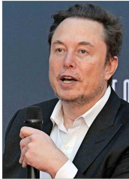
MUSK LLAMÓ "dictador" a De Moraes por las exigencias que ha hecho a X.

El juez del supremo ha tenido una incidencia cada vez mayor en la política nacional desde marzo de 2019 cuando comenzó a impulsar una indagatoria contra personas, principalmente bolsonaristas, que promovían y financiaban la difusión de informaciones no verificadas. Así, se posicionó como el principal personaje en la lucha contra las noticias falsas, pero los seguidores de Bolsonaro lo acusaron de una persecución.