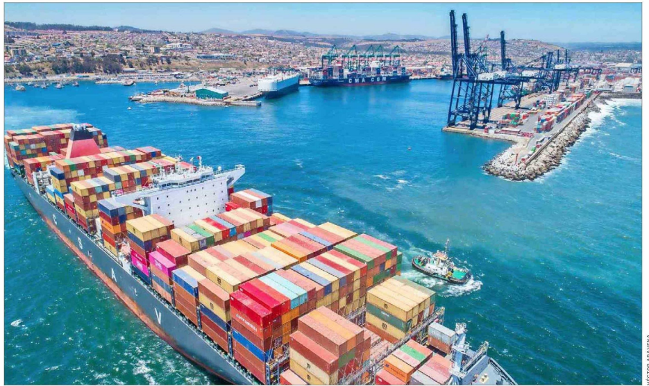
El Puerto Exterior, cuyo proceso de licitación se inició en enero, tendrá una capacidad total para seis millones de contenedores.

de contenedores movilizó el Puerto de San Antonio durante 2024, volumen similar a 2019.