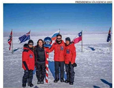
BORIC Y SU COMITIVA EN LA EXPEDICIÓN “ESTRELLA POLAR III”.