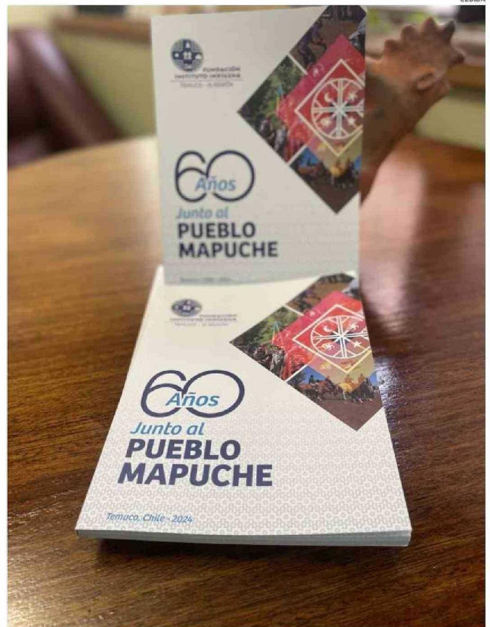
EL LIBRO PRESENTADO CONDUCE A RECONOCER DIFERENTES EXPERIENCIAS CON LAS QUE SE HA IDO CONSTRUYENDO LA HISTORIA DE RELACIONES ENTRE EL PUEBLO MAPUCHE, EL ESTADO Y LA FUNDACIÓN.