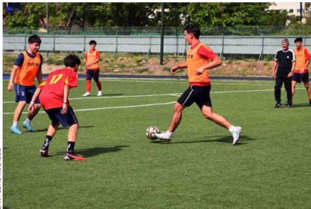
SAN PEDRO NOLASCO

El Colegio San Pedro Nolasco de Santiago tiene una larga historia, la cual nace desde el comprender que la labor educativa es un espacio de formación y evangelización privilegiado. Se trata de un horizonte de acción apostólica que movió a los religiosos mercedarios hace 138 años. “Es así como nace nuestro colegio y se ha mantenido por tantos años en la perspectiva de saberse actualizar y vincular en su