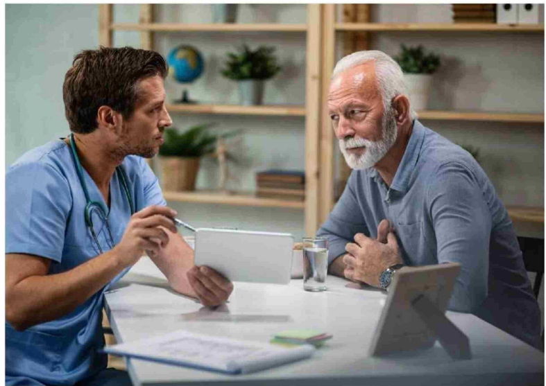
EL DEPARTAMENTO DE ESTADÍSTICAS E INFORMACIÓN de Salud reportó 2.108 decesos por cáncer de próstata durante 2016 en Chile.

"El cáncer de próstata debe ser considerado un cáncer