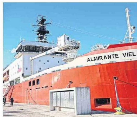
ALMIRANTE VIEL FUE ENTREGADO EN JULIO.