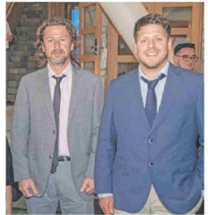
© Antonio Perocarpi , director de revista Tell Magazine, y Franco Perocarpi .