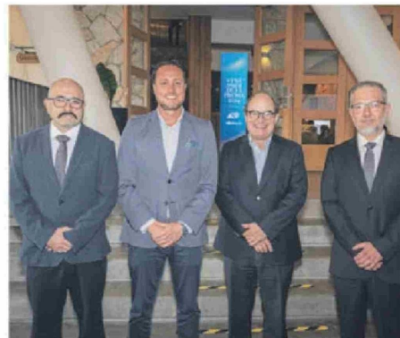
© Calor Vejar , editor de El Llanquihue; Rodrigo Wainra/hgt , alcalde de Puerto Montt; Rodrigo Prado , gerente general del Austral de la Araucanía, y Marco Salazar , director del diario El Llanquihue.