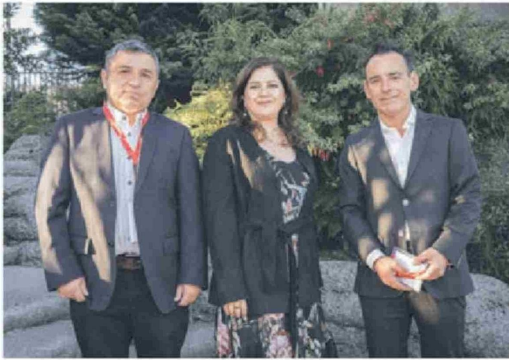
© Oswaldo Soto , director de Grupo Diario Sur; Rosa Villalobos , de Grupo Diario Sur; y Mauricio Rivas , director del diario Austral de Temuco.

Título: Libertad de prensa: Cuidar al periodismo para cuidar la democracia