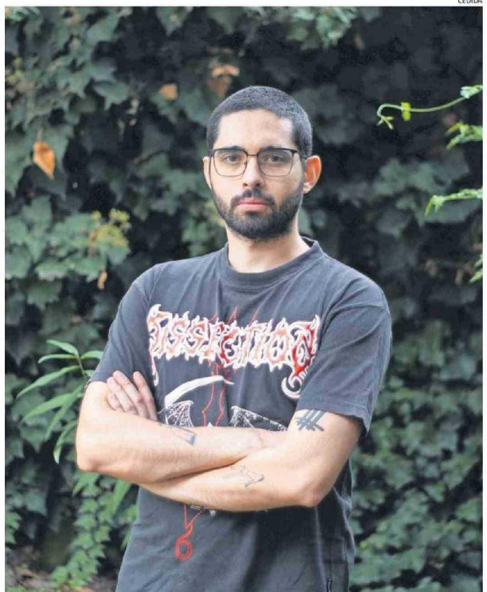
"ME PARECIÓ UN DEBER PUBLICAR ALGO PARA QUE SE HABLE DEL TEMA" SALUD MENTAL, DICE EL AUTOR.

— Afortunadamente soy independiente, no tengo que darle explicaciones a nadie y para mí es un tema súper importante: así como hay gente que tiene la bandera de lucha de los pueblos indígenas u otra causa, mi bandera es la salud mental, y tengo el privilegio de que se me da la escritura, que sé mucho del tema y me pareció más bien un deber publicar algo para que se ha-