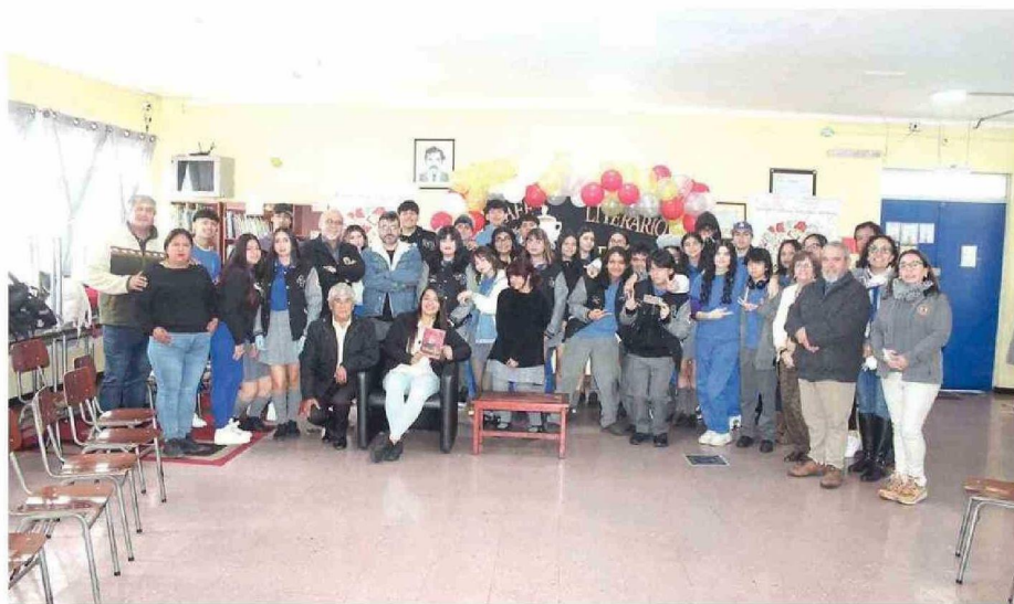
ESTUDIANTES COSAFINOS PRESENTARON GRANDES OBRAS Y PARTICIPARON ACTIVAMENTE EN ESTA INICIATIVA DE FOMENTO LECTOR.

Aquí el escritor respondió dudas sobre la obra, las cuales fueron manifestadas por los estudiantes, co-