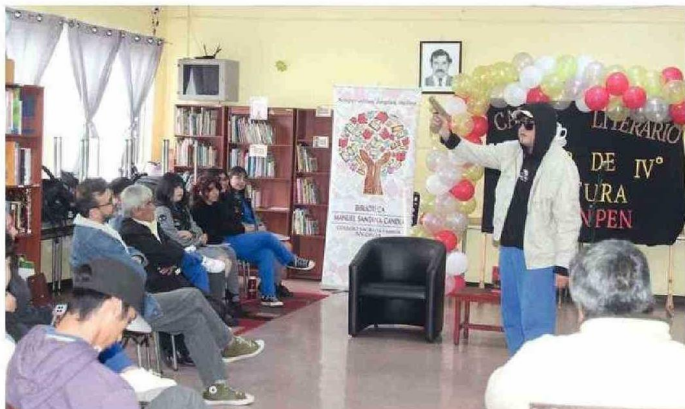
ALGUNOS ESTUDIANTES "TEATRALIZARON" SUS ESCRITOS, DESTACANDO POR SU CREATIVIDAD.