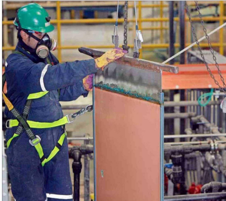
Durante noviembre, el precio del cobre acumula una caída del 7%.

"A pesar de un paquete de estímulo económico de US$ 1,4 bi-