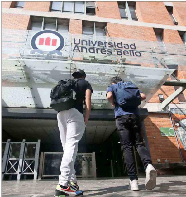
La Universidad Andrés Bello tiene 55 mil alumnos de pregrado, y es la más grande del sistema chileno.

Asegura que la operación forma parte del proyecto de internacionalización de la U. Andrés Bello. “Lamento de verdad las cosas que están pasando en el sistema chileno, universidades a las cuales quiero mucho que están en dificultad”, dice.