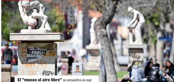
El "museo al aire libre" se encuentra en mal estado, con rayados y algunas de las obras destruidas.