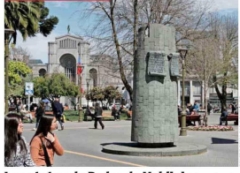
La estatua de Pedro de Valdivia fue derribada por vándalos y arrastrada por 200 metros.