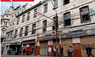
Al igual que en otras urbes, el comercio en el centro de la ciudad puerto aún no se recupera.

"La pérdida patrimonial fue significativa, si se considera que dichas obras eran de excelente factura e irremplazables desde una perspectiva historiográfica y artística".