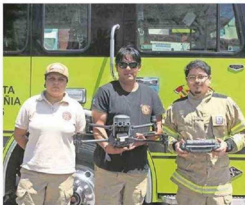
ELLOS SON LOS OPERADORES CERTIFICADOS POR LA DGAC.