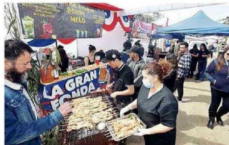
FUNCIONARÁN HASTA EL VIERNES DE 12 A 23 HORAS.