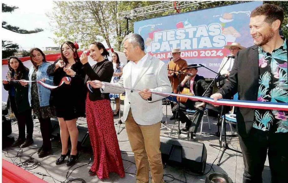
LA ALCALDESA CORTÓ LA CINTA JUNTO A CONCEJALES Y FUNCIONARIOS DEL MUNICIPIO.

Después de bailar varios pies de cueca y tomar chicha en un cacho, la jefa comunal expresó que “queremos que sea un evento familiar para todos los sanantoninos y sanantoninas, completamente gratuito, tendremos shows durante todo el día, vinculados con las Fiestas Patrias, además de una oferta gastronómica de los fonderos y fonderas, y con otros emprendedores, ya que entendemos que estas