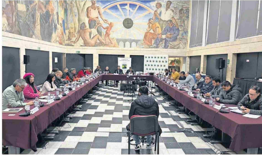
La ejecución del presupuesto 2024 es 15% menor a la que había a igual fecha del año pasado. Las coletazas del caso Convenios han incidido.