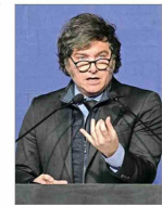
Mandatario trasandino usa las redes sociales para sus ataques.

Asalto a blindado en Rancagua Prófugos de robo a Brink's huyen con $12 mil millones: Tribunal decide hoy cautelares de detenidos > De los 18 imputados, 12 tienen condenas anteriores y uno recibió dos veces beneficios penitenciarios. C 4