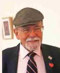
José Maza, astrónomo y escritor.