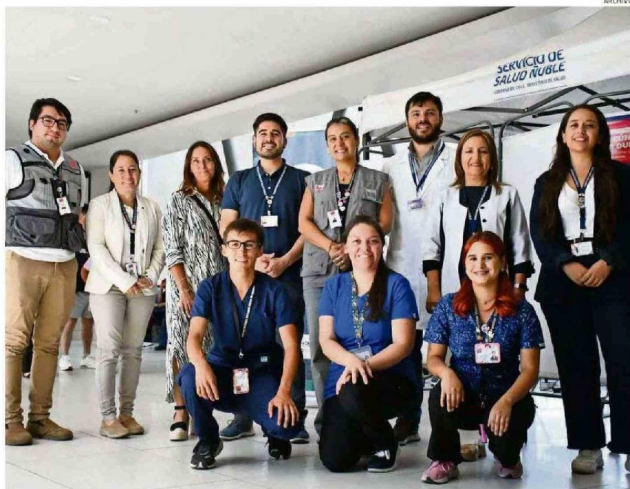
EQUIPOS DE SALUD SE DESPLGARON EN EL MALL ARAUCO CHILLÁN, PARA DAR INICIO A LA VACUNACIÓN CONTRA VIRUS INVERNALES EN ÑUBLE.

En esa línea, la seremi de Salud, recaló que, "los grupos objetivos de la campaña de vacunación contra la influenza, Virus Respiratorio Sincial y Covid-19, podrán recibir su inmunización desde el primero de marzo, sin importar si la persona es Fonasa o Isapre, acudiendo a cual-