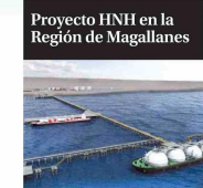
Proyecto HNH en la Región de Magallanes

A fines de julio pasado, el consorcio HNH Energy ingresó a tramitación ambiental su proyecto de producción y exportación de amoníaco verde en la Región de Magallanes, que contempla una inversión de US$ 11 mil millones .