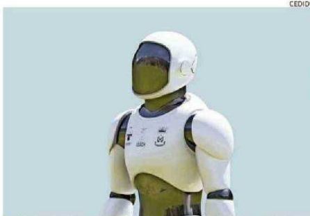
Así lucirá el robot una vez terminado. Se moverá con ruedas.