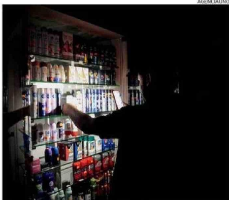
LA EMERGENCIA NO QUEDÓ RESUELTA ANOCHES.

fuerte tormenta con vientos de gran intensidad y lluvias torrenciales dejó sin electricidad a la capital, generó un caos similar y enervó a la población, que en ciertos sectores estuvo casi un mes sin suministro.